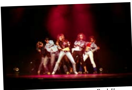
Сцена из спектакля театра «Funk U»

В недалёком 1997 году, в молодёжном доме Itäkeskus (Хельсинки, Финляндия), под банальной эгидой кружка уличного танца собралась и провела свою первую тренировку небольшая группа молодых людей. Постепенно развиваясь и узнавая много нового про танец и про самих себя, девушки и юноши всё больше увлекались новым для них занятием. По истечении шести месяцев, когда курсы закончились, практически все обратились ко мне с просьбой продолжить занятия.