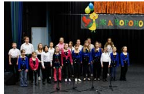
Выступление хора «Колокольчик»