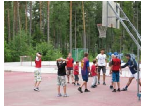
Лагерь «Природа и спорт»

на турбазе «Ахтела» порадовал нас различными спортивными и творческими кружками. Каждое утро с 10-13 часов дети были заняты на футбольных и баскетбольных площадках, в столовой проходили художественные кружки, ребята увезли домой поделки из шишек, растений, брелки, маски и многое другое.